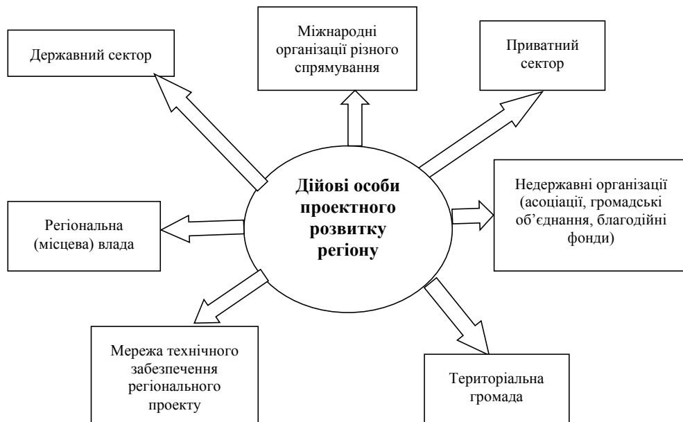
Рис. 2. Дійові особи проектного розвитку регіону

На рис. 2 наведено «дійові особи» проектного розвитку регіону, тобто суб'єкти, які можуть ініціювати, реалізувати або взяти участь у реалізації, фінансувати регіональний проект і користуватись його результатом.